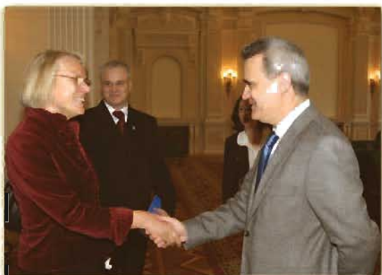
Întrevederea dnei. dr. Susanne Kastner cu dl. senator Dan Mircea Popescu

La nivel parlamentar, programul vizitei a inclus întrevederi cu: dl. senator Corneliu Pascu , Vicepreședinte al Senatului; dl. deputat Valer Dorneanu , Vicepreședinte al Camerei Deputaților; dl. senator Dan Mircea Popescu , președintele Grupului parlamentar de prietenie România-Germania și cu membri ai Grupului.