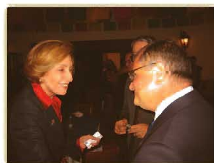
Dna. Rosario Green Macías, președinta Comisiei de Relații Externe a Senatului mexican, membră a Grupului consultativ al Comisiei UIP pentru Națiunile Unite

În marja reuniunii parlamentare, dl. senator Dan Sabău a avut o scurtă discuție cu dna. Rosario Green Macías , președinta Comisiei de Relații Externe a Senatului mexican, fost ministru al afacerilor externe, prilej cu care interlocutorii au evocat evenimentele importante care au marcat evoluția relațiilor parlamentare româno-mexicane și au exprimat dorința comună de dezvoltare a dialogului dintre cele două părți.