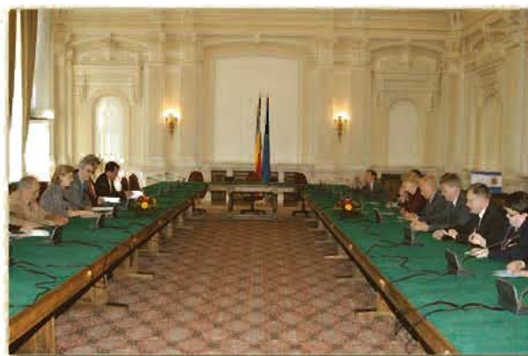
Convorbiri bilaterale între delegațiile celor două Grupuri parlamentare de prietenie