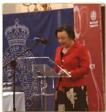
Dna. Gerdi A. Verbeet