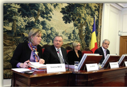
Colocviul cu tema „130 de ani de relații diplomatice româno-belgiene”

deosebită. S-a manifestat interesul reciproc de dezvoltare a cooperării la nivelul Uniunii Europene, în domenii precum energia, integrarea socială a romilor, infrastructura portuară și protecția mediului înconjurător.