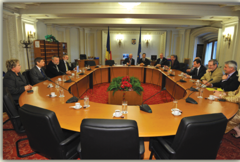
Întrevederea domnului deputat Ilan Gilon cu membrii Grupului parlamentar de prietenie România-Israel

Autorității Naționale pentru Persoanele cu Handicap, prilej cu care a fost realizată o prezentare succintă a cadrului legislativ românesc în domeniul protecției și promovării drepturilor acestor persoane.