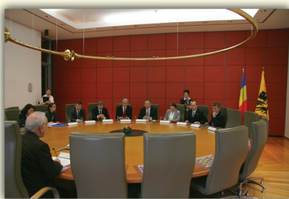
Convorbiri cu președintele Parlamentului Flamand