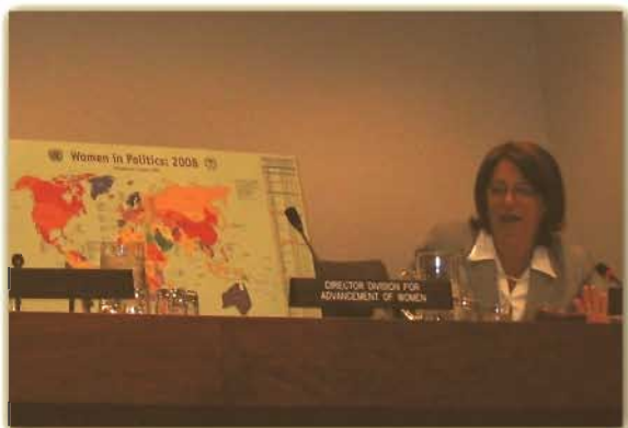
Dna. Monica Xavier