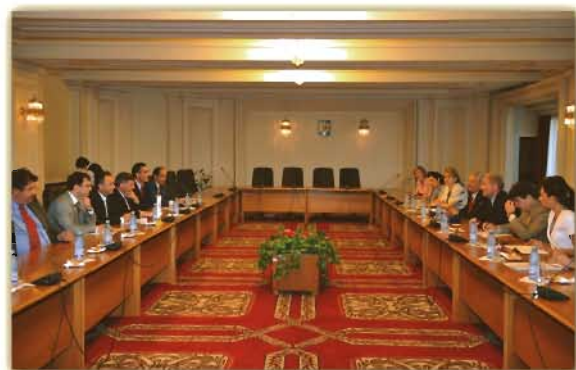
Întrevederea delegației cipriote cu membrii Comisiei pentru politică externă a Camerei Deputaților

În cadrul convorbirilor bilaterale au fost evidențiate bunele relații existente între România și Cipru, în domeniile politic, economic și cultural.