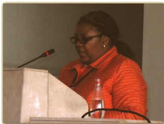
Dna. Nosiviwe Noluthando Mapisa-Nqakula

În deschiderea lucrărilor, a luat cuvântul dna. Nosiviwe Noluthando Mapisa-Nqakula, ministrul de interne sud-african.