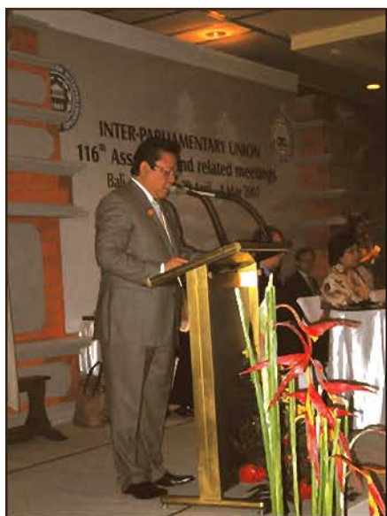
Dl. Agung Laksono

Cea de-a 116-a Adunare a UIP s-a întrunit în zilele de 30 aprilie, 1, 3 și 4 mai, sub președinția dlui. Agung Laksono, Președintele Camerei Reprezentanților din Indonezia.