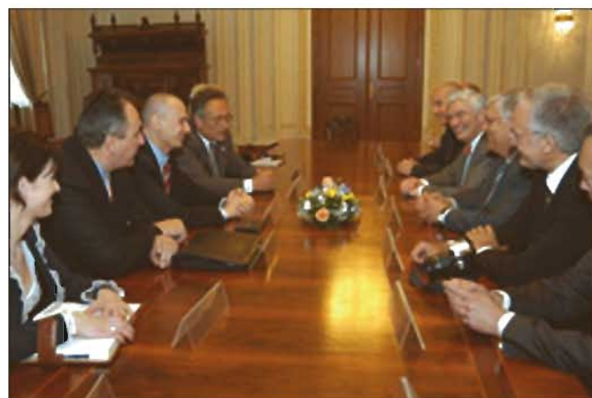
Primirea delegației franceze de către Bogdan Olteanu, Președintele Camerei Deputaților