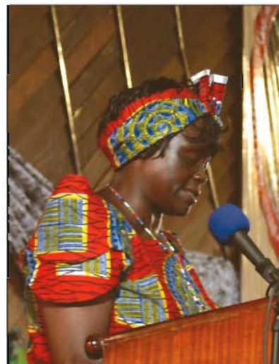
Wangari Maathai, laureată a Premiului Nobel pentru Pace