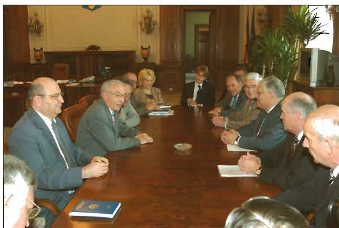
Primirea delegației franceze de către Nicolae Văcăroiu, Președintele Senatului

Discuțiile bilaterale s-au axat pe pregătirea României în vederea apropiatei aderări la Uniunea Europeană. Oaspeții francezi au manifestat un real interes față de măsurile adoptate de țara noastră în vederea îndeplinirii obligațiilor legate de aderare și au apreciat progresele substanțiale înregistrate în domenii cheie ale reformei interne, precum: justiția, combaterea corupției, protecția mediului.