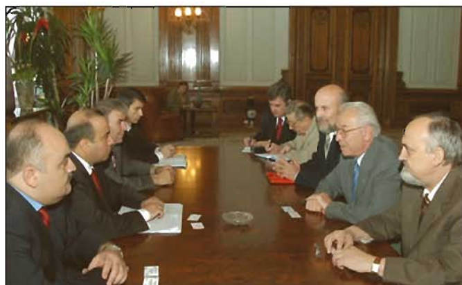
Primirea delegației azere de către Nicolae Văcăroiu, Președintele Senatului

Discuțiile bilaterale la nivel guvernamental au permis conturarea zonelor de interes pentru partea