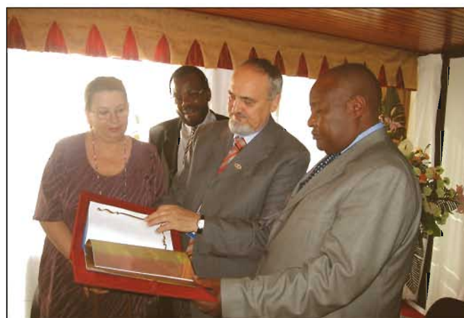
Înt alnirea delegației GRUI cu Francis Ole Kaparo, Președintele Adunării Naționale a Republicii Kenya

S-a apreciat că este necesară dezvoltarea cooperării economice și a schimburilor comerciale dintre cele două țări, inclusiv prin valorificarea pozițiilor lor geo-strategice în Europa și, respectiv, pe continentul african.