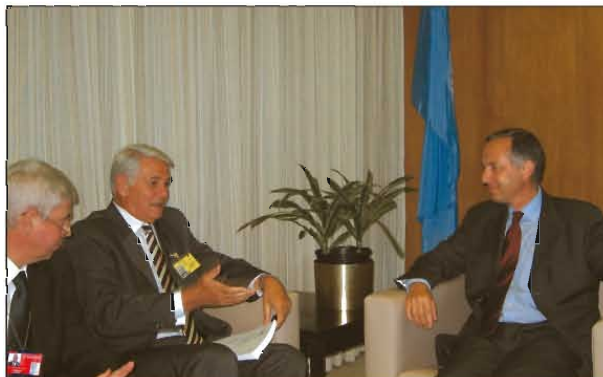
Convorbiri cu dl. Georgi Georgiev Pirinski, Președintele Adunării Naționale, Bulgaria

parlamentele naționale și ONU , perspectivele construirii unei dimensiuni parlamentare a Organizației și rolul UIP.