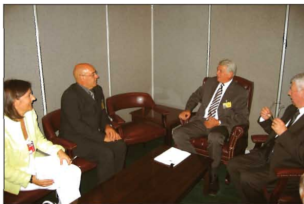
Convorbiri cu dl. Francisco Javier Rojo García, Președintele Senatului, Spania

Pe parcursul celor trei zile ale Conferinței, delegația română a avut un număr important de întrevederi bilaterale , acordându-se prioritate dialogului cu liderii de parlamente din Uniunea Europeană, în vederea susținerii procesului de ratificare, de către parlamentele naționale ale țărilor membre, a Tratatului de aderare a României.