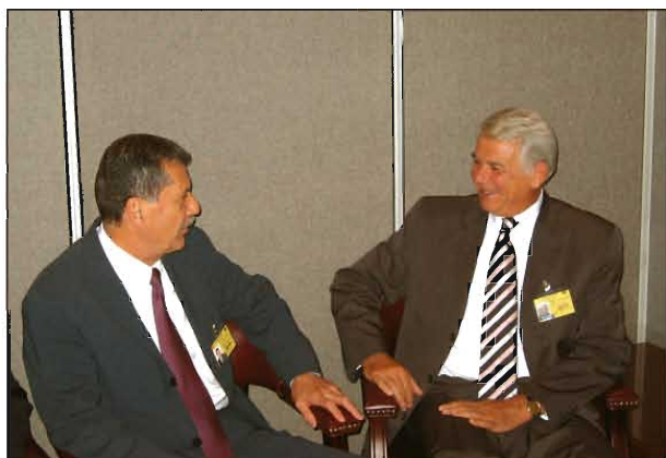
Convorbiri cu dl. Enrique Jackson Ramirez, Președintele Camerei Senatorilor, Mexic

În linii generale, în cadrul schimburilor de opinii au fost abordate trei teme principale: problematika europeană - progresele României în procesul de integrare europeană; stadiul și perspectivele procedurilor de ratificare, de către parlamentele din UE, a Tratatului de aderare a României; pregătiri pentru participarea observatorilor români la lucrările Parlamentului European; relațiile parlamentare bilaterale cu diferite țări (stadiu, modalități și direcții de dezvoltare); relațiile dintre