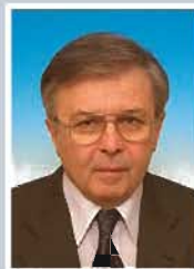
GHEORGHIUF Titu Nicolae Deputat PNL