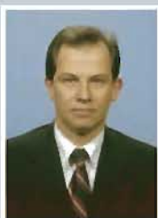
SÓGOR Csaba Senator UDMR