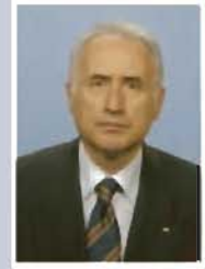
GHEORGHE Șerbu Vergil Senator Alianța D.A.