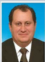
PODGOREAN Radu Deputat PSD