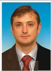
PALĂR Ionel Deputat PNL