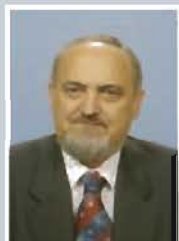
SOLCANU Ion Senator PSD