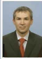
STRĂTILĂ Șerban Cezar Senator Alianța D.A.