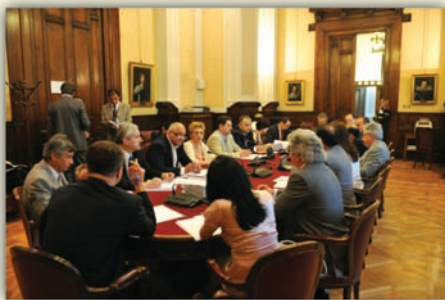
Convorbiri bilaterale între delegațiile celor două grupuri de prietenie