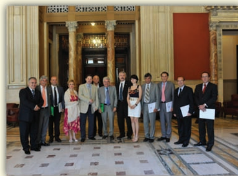
Fotografie de grup

A fost evidențiată contribuția pozitivă a comunității românești din Italia și a comunității de afaceri italiene din România la dezvoltarea economică a celor două state, cu atât mai importantă în contextul crizei economice. Cele două părți și-au manifestat interesul de a coopera mai strâns la nivelul Uniunii Europene, unul dintre obiectivele de interes comun fiind promovarea incluziunii sociale a comunității rome.